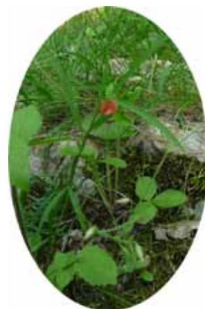
Gesse à graines sphériques

L'accompagnement des communes par JNE se poursuivra jusqu'en décembre 2011. Mais les seuls gages de préservation durable de ces pelouses sèches sont l'implication de la population locale dans le respect et l'entretien de cet espace naturel. L'écovolontariat, action éco-citoyenne par excellence, est l'un des principaux outils à notre disposition.