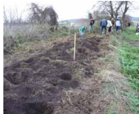
La future haie de Menotey

Le samedi 5 décembre, une épaisse haie champêtre est implantée sur les hauteurs de Menotey, au nord de Dole (pourtour du massif de la Serre) en partenariat avec notre association locale, Serre Vivante. 80 végétaux d'une vingtaine d'essences autochtones sont plantés en continuité des boisements déjà existants et permettent, notamment, d'augmenter les territoires de chasse du vespertilion à oreilles échancrées, chauve-souris menacée en Europe occidentale, ayant établi une colonie de reproduction dans le clocher de la commune.