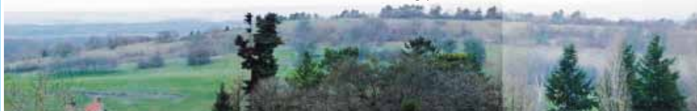
Pelouse restaurée de Chevigny