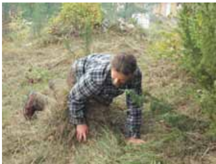
Louvenne – Un mode d'exportation des produits de fauche...

Samedi 10, une action de réouverture d'une pelouse sèche sur Louvenne, en Petite Montagne jurassienne, a été réalisée en partenariat avec l'ADAPEMONT et la commune. Elle a permis d'étendre un espace ouvert, tout en conservant quelques bosquets et haies buissonnantes, faisant déjà l'objet d'une convention de pâturage entre l'ADAPEMONT et un riverain propriétaire de moutons dans le cadre des contrats NATURA 2000.