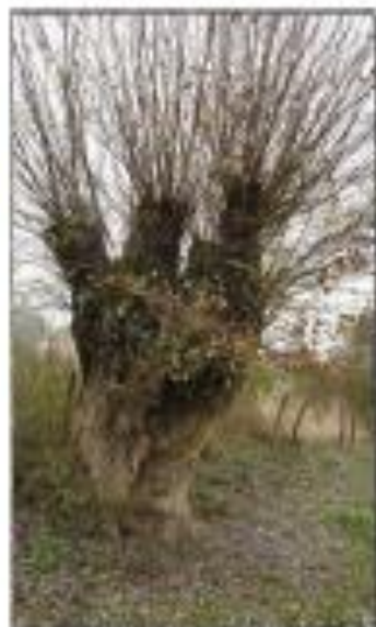
Un saule têtard âgé, récemment élagué.

Nous continuons en parallèle nos actions de formation auprès des futurs agriculteurs (avec le développement d'un partenariat au CFPPA de Montmorot) et des exploitants laitiers à Comté (par le biais de deux interventions avec le Comité Interprofessionnel du Comté).