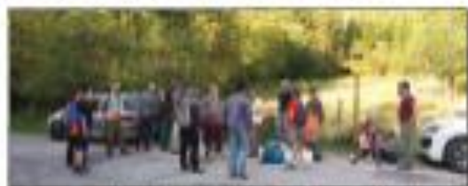
Journée de formation botanique et de récolte, au Mont Poupet.

Ces actions, menées en réseau avec FNE BFC et ses asso membres, ont assuré la collecte de graines de 19 espèces d'arbres et arbustes, livrées à l'automne à plusieurs pépinières locales. A ce titre, nous nous réjouissons de la participation d'un nouveau professionnel installé à Pratz dans le Haut-Jura, déjà producteur de plantes « sauvages et locales ». Ses premiers plants certifiés « Végétal Local » devraient sortir de pépinière d'ici 2 à 3 ans.