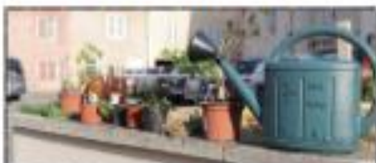
Les jardins de la Comédie, lieu de rencontres... et de jardinage !

Dans le cadre de la politique de préservation des Espaces Naturels Sensibles du Département, JNE s'est particulièrement investie cette année sur les pelouses sèches du Revermont et du Massif de la Serre. Plusieurs collectivités ont été rencontrées, pour trouver des solutions d'entretien et de valorisation de ces espaces agricoles à forte valeur écologique, mais aujourd'hui souvent délaissés. Cela a abouti fin 2018 sur la recouverture de plusieurs pelouses enfrichées, dans le cadre d'un partenariat avec le LEGTA de Montmorot. Un contrat a aussi été passé avec une bergère du premier plateau pour réinstaurer un pâturage extensif bénéfique à ces milieux.