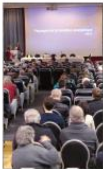
Une soirée Plateau Débat Public : débats à gène, sur le thème de l'éolien au Carcom (Lons).

Quelques semaines plus tard s'est tenu le débat sur l'utilisation des produits phytosanitaires, à Pierre de Bresse. Comment réduire l'utilisation des phytos ? comment réduire leur impact, voir stopper leur utilisation ? Autant de sujets sur lesquels collectivités, agriculteurs, bureau d'étude, Etat, associations et citoyens ont pu échanger