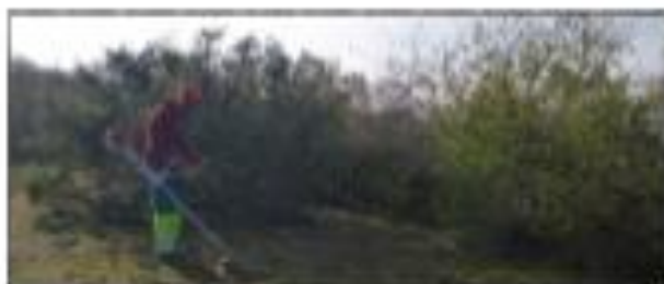
Chantier de recouverture des prairies sèches, avec les STS GPN de Montmorot.