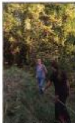
Débroussaillage au Parc Antier !