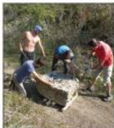
Chantier pierre sèche sur la réserve de Mancy !

Dans son rôle de vigilance auprès des acteurs de l'aménagement du territoire, JNE a également pris part à de nombreuses réunions techniques. Pas moins de 64 représentations tout au long de l'année, réparties entre bénévoles et salariés. Merci encore pour votre implication dans ces commissions et réunions, qui, au-delà de notre mission de veille environnementale, participent à notre rayonnement à travers le département !