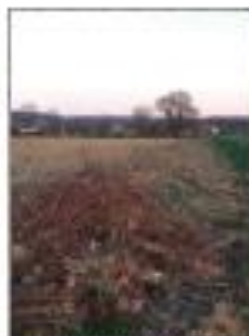
Arrachage de haie, près de Lons

Cette année 2018 a également été marquée par la recrudescence des signalements pour destruction de haies et bosquets. Citons les cas de Saint Didier, Gevingey, mais aussi du Premier plateau ou encore à Reilhousse (ayant donné lieu à des échanges avec le GAB). Les informations sont systématiquement transmises à la DOT et l'ONCS. Face à ces cas nombreux chaque année, JNE s'interroge sur la stratégie à adopter ces prochaines années.