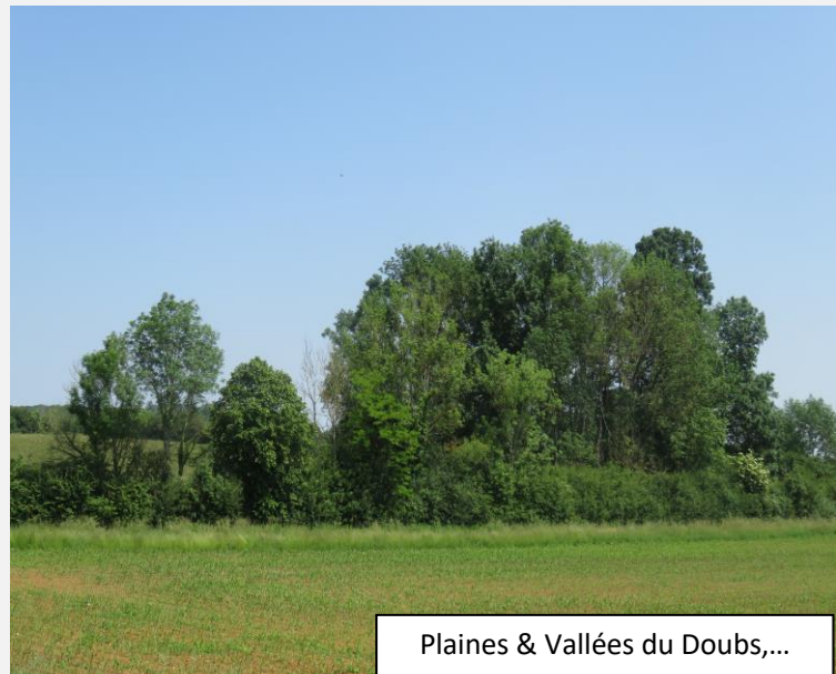
Plaines & Vallées du Doubs,...