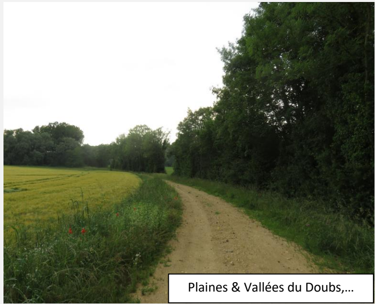
Plaines & Vallées du Doubs,...