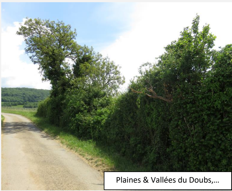
Plaines & Vallées du Doubs,...