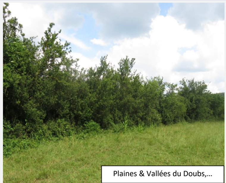
Plaines & Vallées du Doubs,...