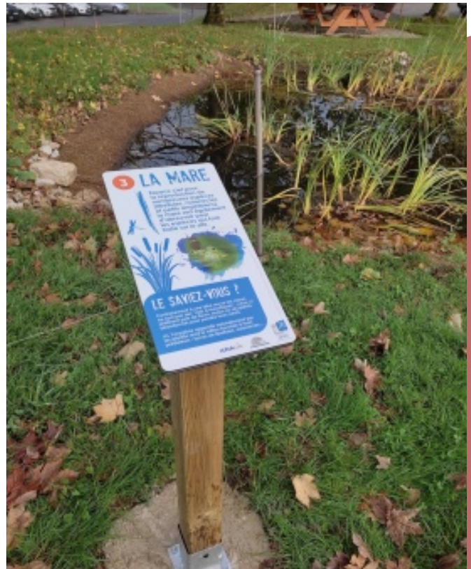
Panneau mare VEOLIA ZI Lons-Perrigny