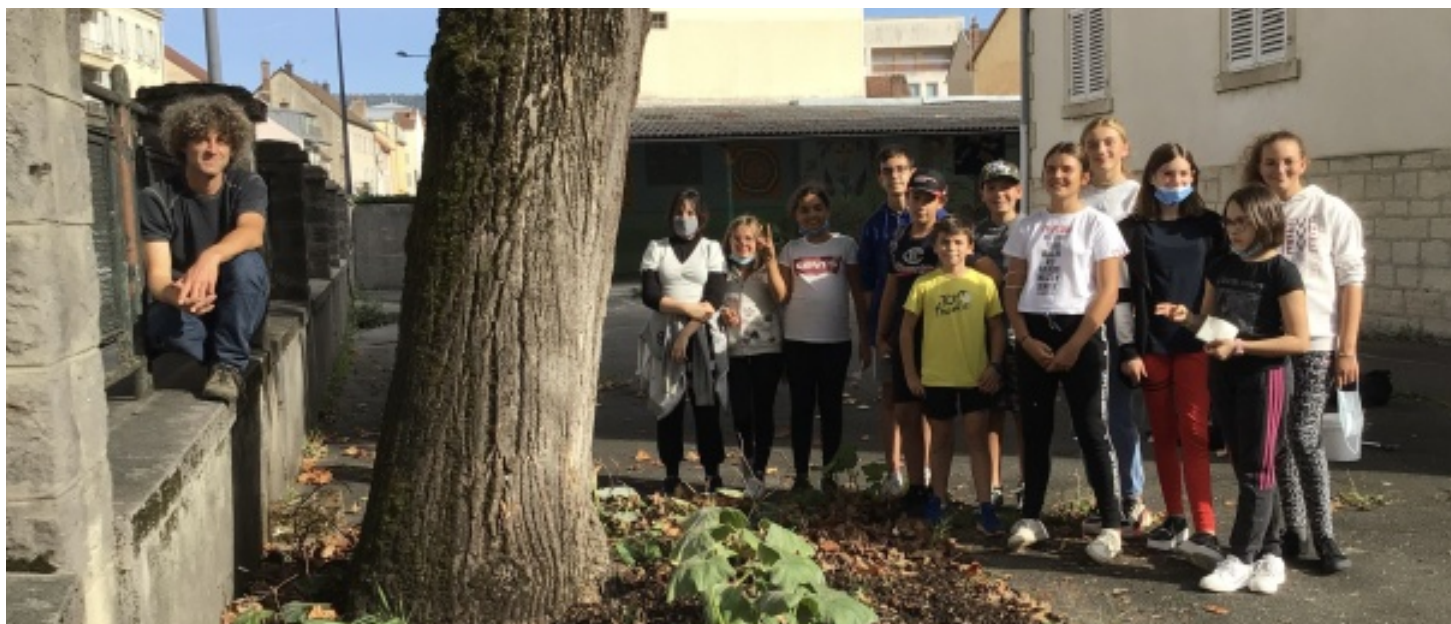
Végétalisation sous le tulipier