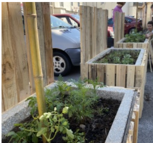
La Cambuse, magasin coopératif

Au final des bacs fleuris ont vu le jour, une terrasse en bois, des composteurs, des accroches vélos, le tout clôturé par une jolie fête d'inauguration.