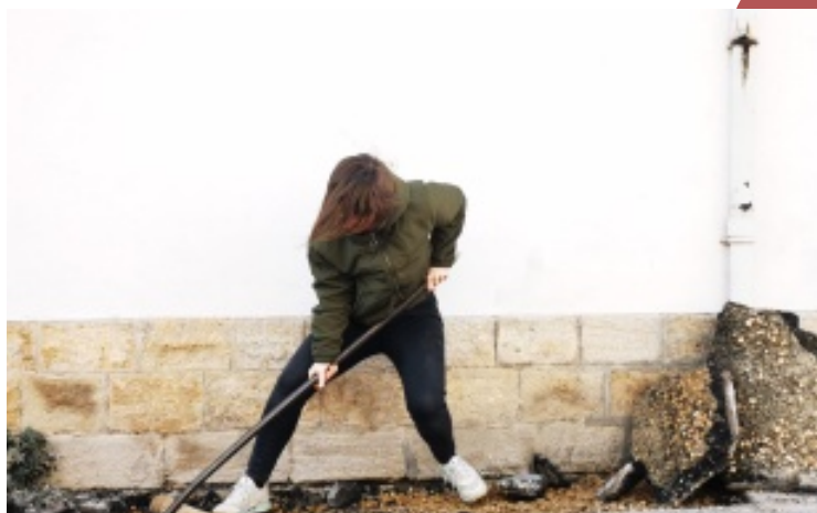
Boeuf sur le toit

En parallèle, c'est dans l'enceinte du Boeuf sur le toit, espace 100% minéral, que des chantiers ont été organisés, en partenariat avec la ville de Lons (propriétaire) et la région BFC (festival des solutions écologiques), pour notamment décroûter et revégétaliser certains pieds de façades.