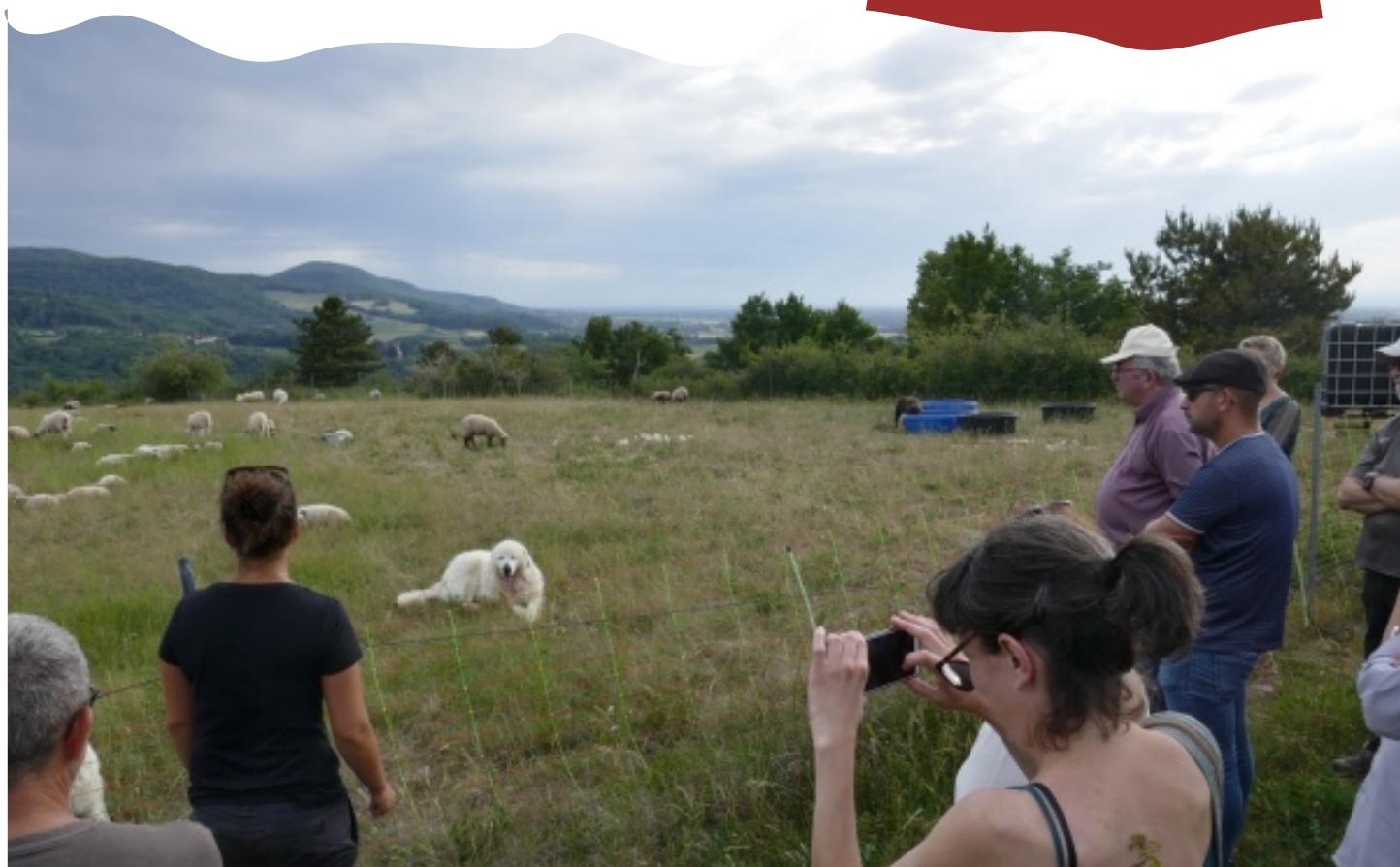
Pelouses sèches Grande Côte

Au-delà des 4 communes labellisées ENS, 12 autres communes ont ainsi été rencontrées par JNE au cours des deux années du programme (2021-2022) dont 4 accompagnées plus spécifiquement pour la réalisation de projets.