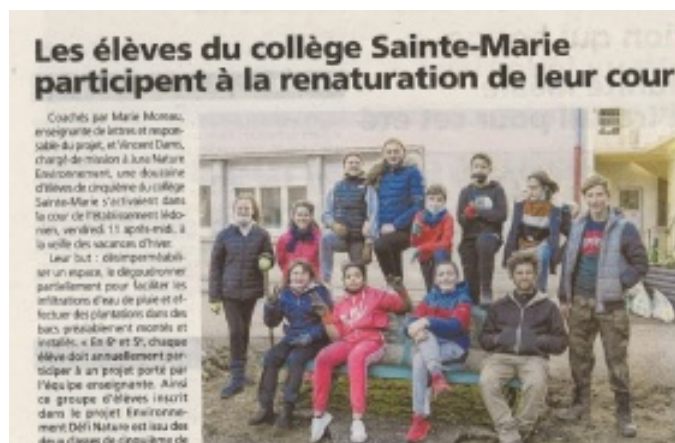
Article Voix du Jura