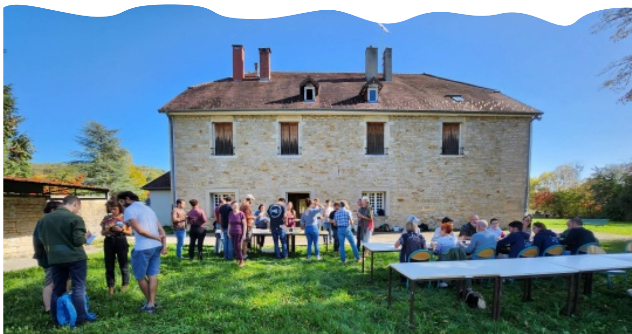
Journée technique du 18 octobre 2022

Une journée à la fois technique et très enthousiasmante pour les projets à venir !