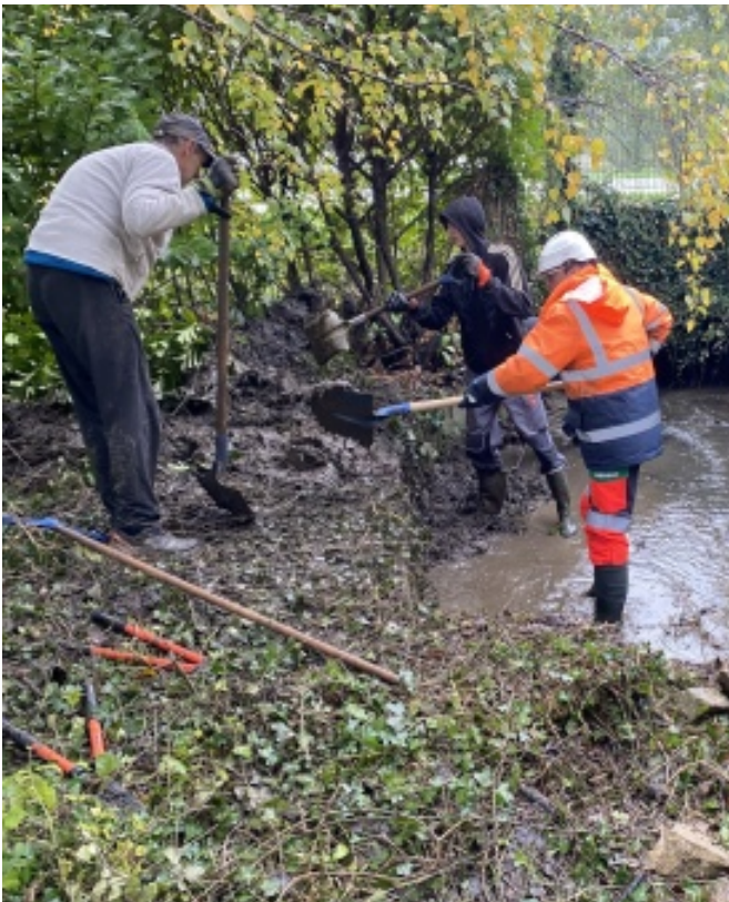
Restauration d'une mare - Speichim-Triadis