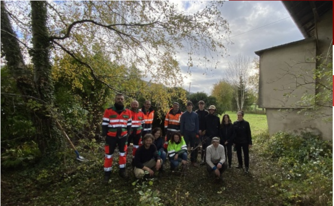
Chantier du 18 novembre 2022 - Speichim-Triadis